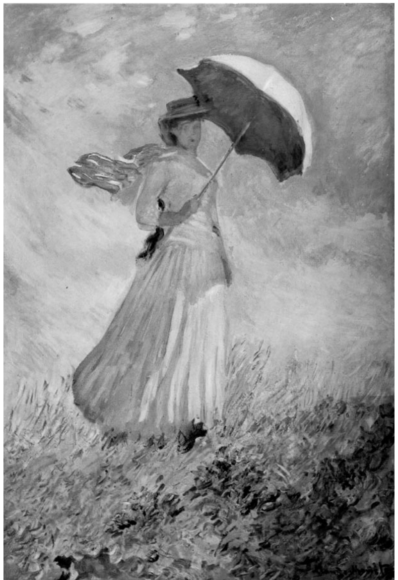
Claude Monet: „Dame mit Sonnenschirm“.

b) Für Xylofone, Metallofone, Streich- und Blasinstrumente eignet sich folgende pentatonische Reihe: c, d, f, g, a (alternativ: c, d, e, g, a). Diese fünf Töne können Sie beliebig kombinieren.