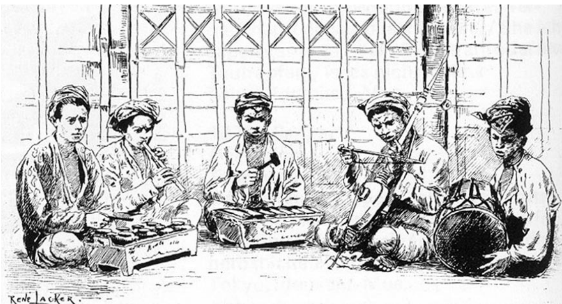
Gamelanmusik auf der Weltausstellung 1889.